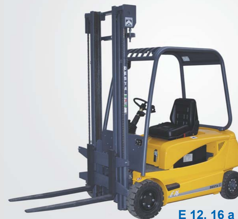
E 12, 16 a 20