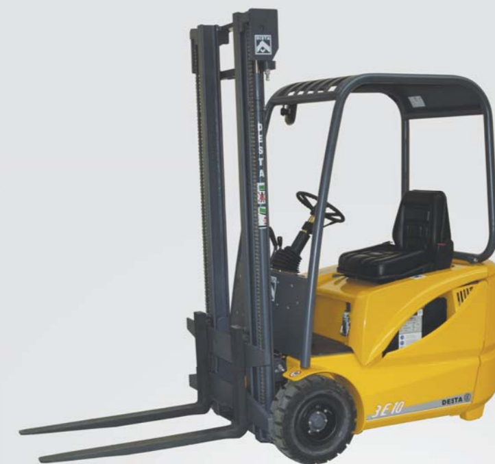
3E 10, 12 a 15

VYSOKOZDVIŽNÉ ČELNÍ AKUMULÁTOROVÉ VIDLICOVÉ VOZÍKY